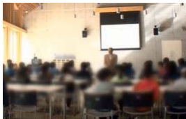
講演及び啓発DVD視聴