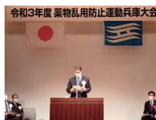
厚生労働省あいさつ

西宮市、(公財)麻薬・覚せい剤乱用防止センター、兵庫県薬物乱用対策推進会議、兵庫県警察本部、兵庫県教育委員会、西宮市教育委員会、神戸税関、神戸海上保安部、兵庫県学校保健会、(一社)兵庫県医師会、(一社)兵庫県薬剤師会、(一社)兵庫県医薬品登録販売者協会、兵庫県医薬品配置協議会、(公財)兵庫県青少年本部、(公社)兵庫県防犯協会連合会、兵庫県遊技業協同組合、兵庫県保護司会連合会、兵庫県更生保護女性連盟、ひょうご地域安全まちづくり推進協議会、兵庫県麻薬協会、ライオンズクラブ国際協会335-A地区、国際ロータリー第2680地区、関西学院大学、武庫川女子大学